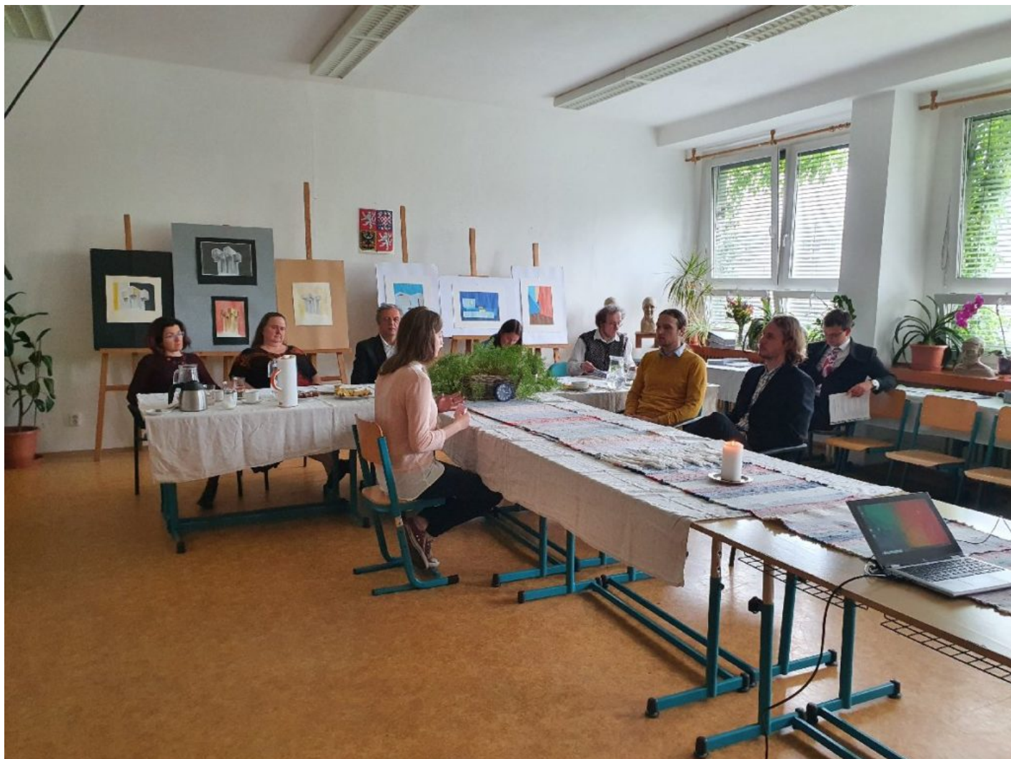
“Vážená maturitní komise, toto téma jsem si vybrala, protože i já si zřejmě budu hledat partnera. Je to téma, které se týká všech.”

Waldorfské lyceum vyžaduje od studentů odbornou práci v jednom ze tří volitelných předmětů. Témata vypisují učitelé. “Na rozdíl od ročníkové práce ve třetáku u té maturitní není téma zcela na studentovi a snažíme se, aby ji zpracoval co nejvíc samostatně,” říká Smolka. Vyzdvihuje hlavně to, že se žák učí pracovat se zdroji a také se učí základní techniku seminární a bakalářské práce, což pak uplatní na vysoké škole.