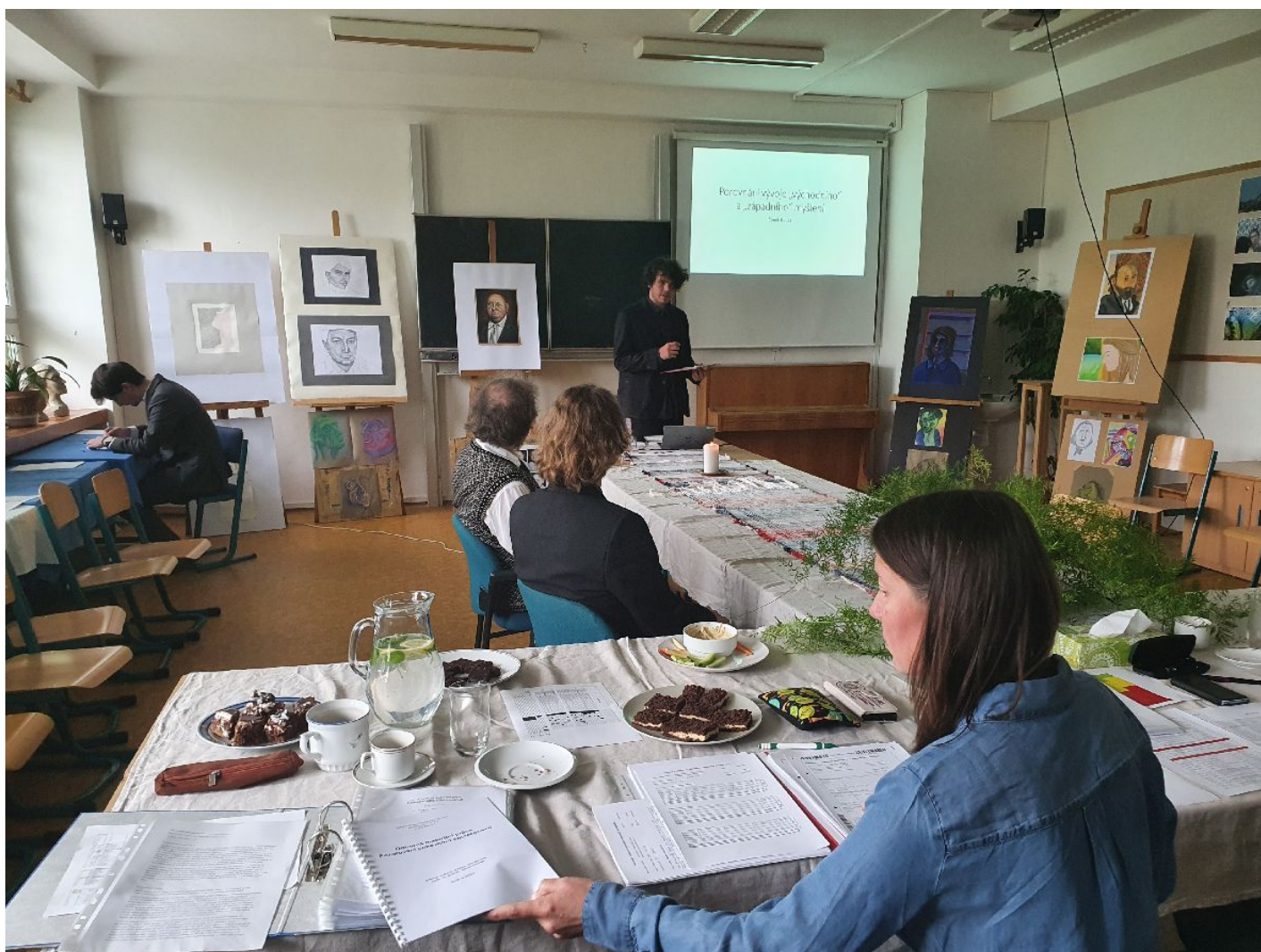
Při obhajobě závěrečné práce můžete i stát. Atmosféra je kolegiální.