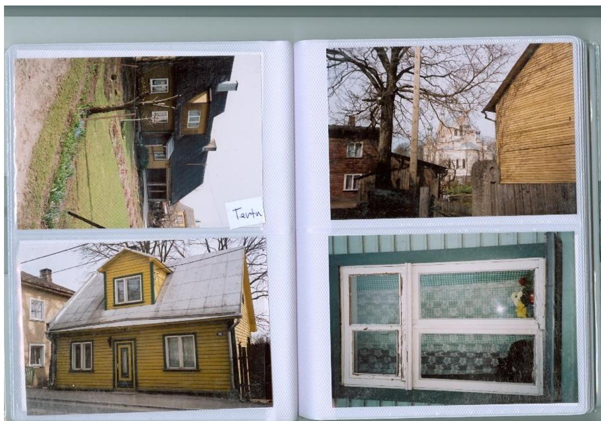
typická estonská zástavba