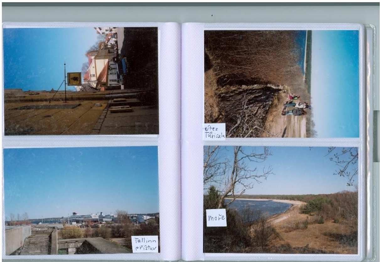
přístav v Tallinnu