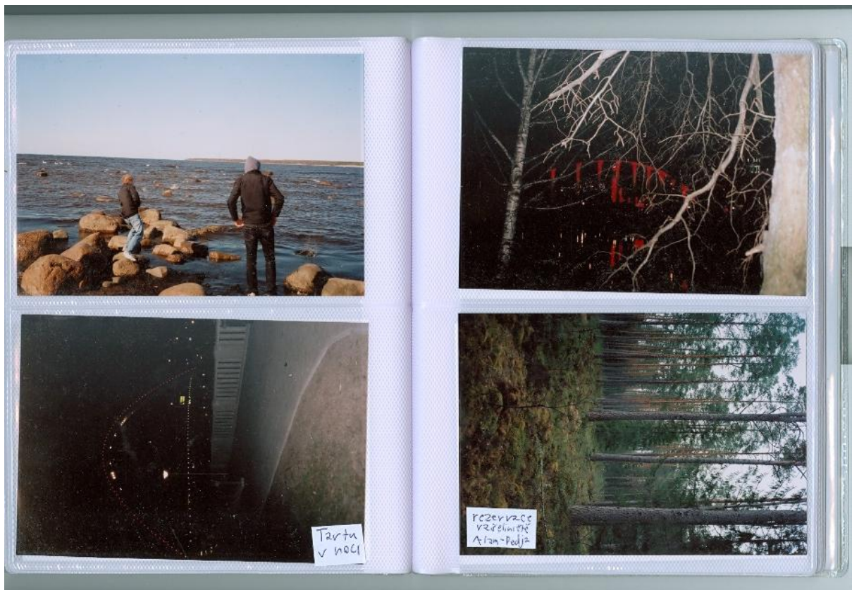
Moře, Tartu v noci a rezervace Alam-Pedja