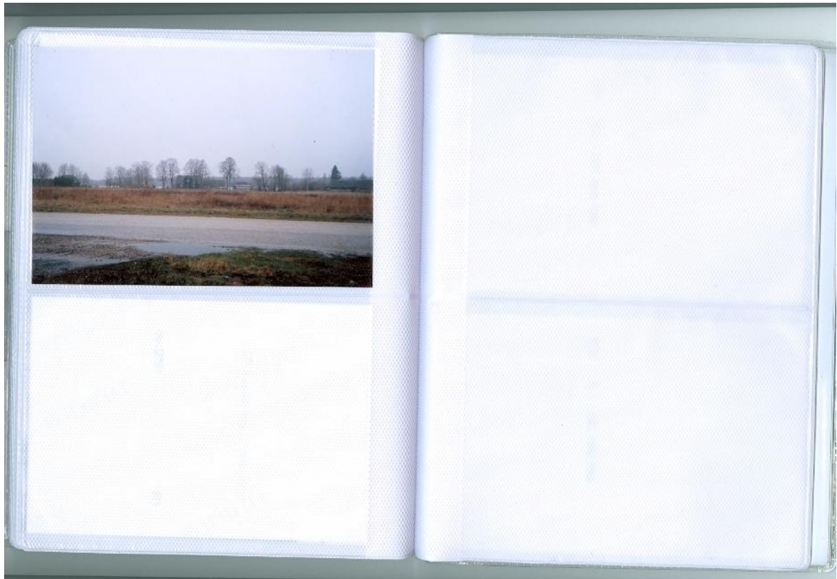
typická estonská krajina (to nic tam taky patří)